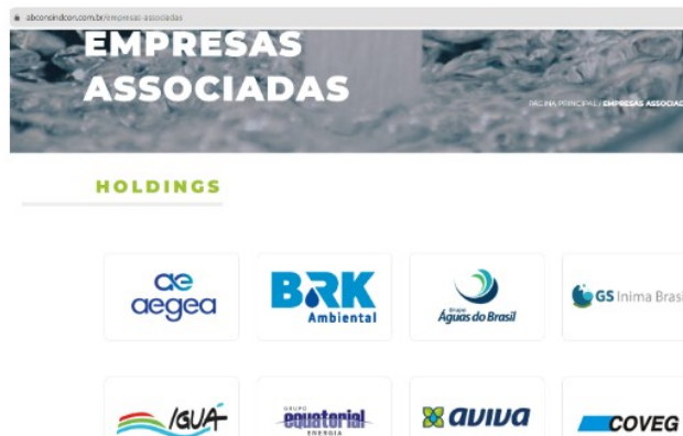
Figura 2 – Cópia de parte da página da ABCON SINDCON para as empresas associadas, onde constam as que serão alvo da fiscalização pelos comitês de monitoramento.

Se possível solicitar apoio do Ministério Público do Rio de Janeiro para assegurar que não haja irregularidade no processo.